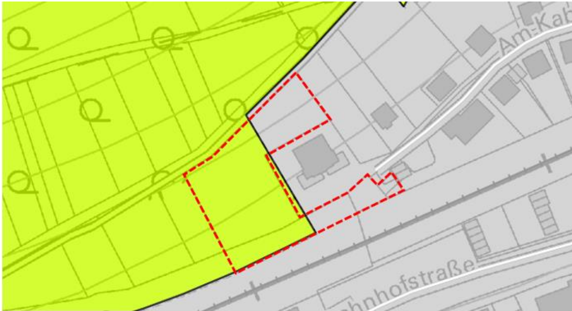
Darstellung des Änderungsbereiches in der Planung vernetzter Biotopsysteme